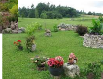
Mājas “Saules kalni”